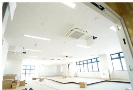
リハビリテーション室